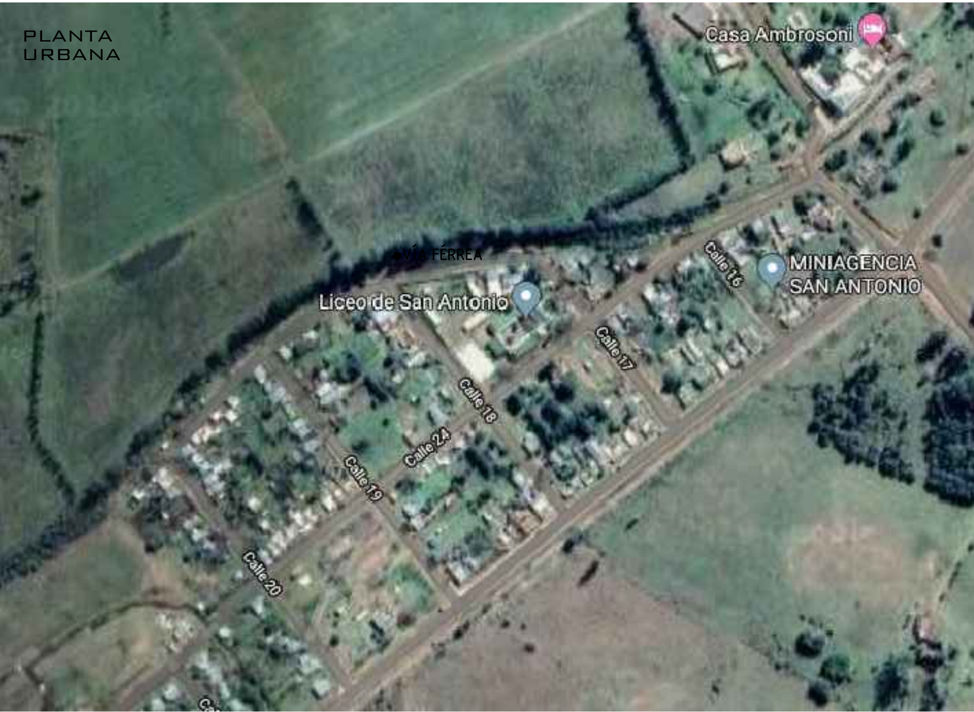
PREDIO DEL CONJUNTO